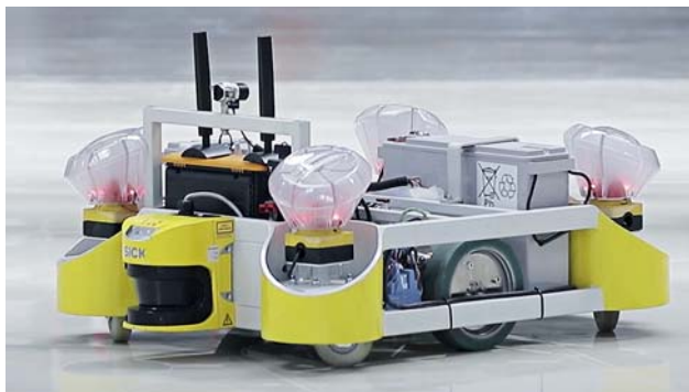
Ob für das Interieur oder das Exterieur der bei Magna produzierten Autos – vom Lager bis zum Roboter übernehmen die fahrerlosen Transportsysteme die Materialbelieferung.

Auf Basis dieser Digital Factory kann Magna Steyr Prozesse in Echtzeit steuern und damit direkt während der Produktion auf Abweichungen reagieren. Um effizienter arbeiten zu können, brauchen die Produktionsmitarbeiter möglichst kurze Wege. Dazu müssen die Steuerungstools zwischen Fertigung und Logistik sehr eng verzahnt und aufeinander aufbauend sein. Die Möglichkeit, mehrere Varianten virtuell gegenüberstellen zu können, reduziert nicht nur die Gehwege der Mitarbeiter, sondern sorgt auch für eine schnellere Produktion durch Teile-Vorverteilung in