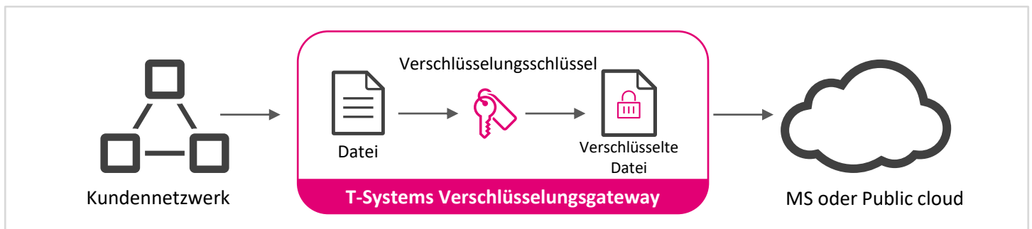
Cloud Privacy als Managed Service

Der Cloud Privacy Service befindet sich zwischen dem Netzwerk des Kunden und der Microsoft 365 Cloud. Der eingehende Datenverkehr wird entsprechend der Konfiguration des Gateways verschlüsselt, so dass nur verschlüsselte Daten in MS365 gespeichert werden. Werden Daten aus MS365 gelesen, entschlüsselt das Gateway diese Daten und macht sie im Klartext nur für den Benutzer lesbar und durchsuchbar. Dazu erzeugt der Cloud Privacy Service 10.000 AES-Schlüssel mit einer Verschlüsselungstiefe von 256 Bit, die nach dem Zufallsprinzip zur Verschlüsselung der Daten verwendet werden. Die Schlüssel werden verschlüsselt im Rechenzentrum der Telekom gespeichert.